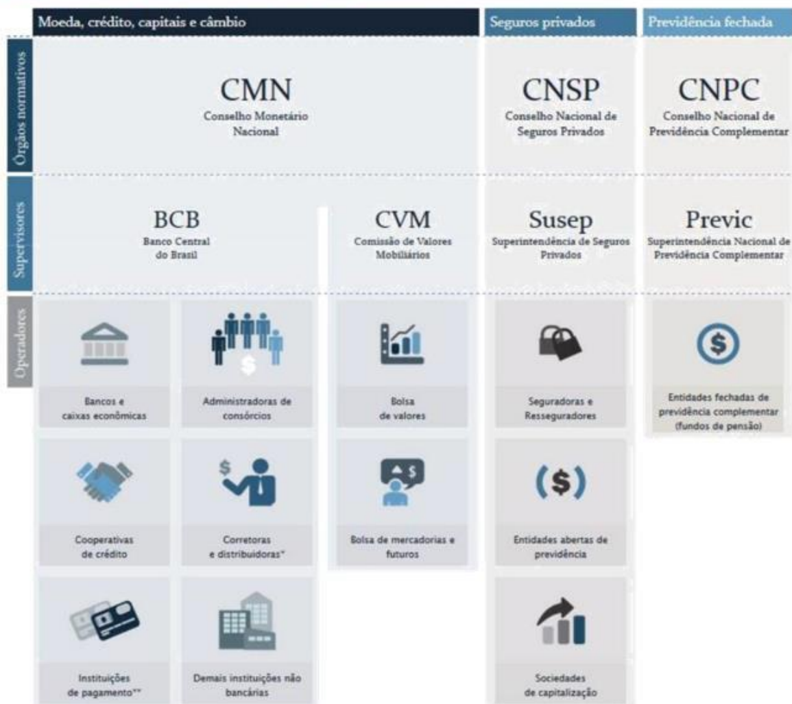
Composição e segmentos do Sistema Financeiro Nacional

O quadro abaixo ilustra a composição do Sistema Financeiro Nacional e a que órgão regulador está vinculado cada segmento. Os dados estão dispostos conforme modelo e informações constantes da página do Banco Central do Brasil na internet.